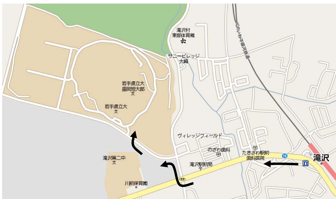
図 1: 滝沢駅から岩手県立大学までの経路

※滝沢駅から岩手県立大学までの地図は図 1 を，キャンパス内の地図は図 2, 3 をそれぞれご覧下さい。